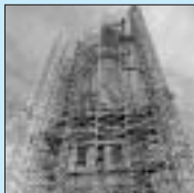
Freiheitsstatue, New York

Für renommierte Baudenkmäler übernimmt Kärcher schon mal kostenlos die Reinigung. Im Rahmen solche PR-Maßnahmen „im besten Sinne“ werden sie von Verschmutzungen aufgrund starker Luftverunreinigungen, Verkrustungen, Kalkablagerungen, Verfärbung durch Kupfer, Verschwärzungen, Graffiti etc. befreit. Kärcher demonstriert damit seine hohe Fachkompetenz und zeigt Goodwill und bringt der jeweiligen Gemeinde einen wirklichen Nutzen.