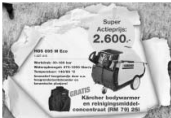
2003 gab es Kärcher Niederlassungen in 34 Ländern. Hier eine Anzeige aus Holland