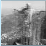
Christusstatue, Rio de Janeiro