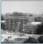
Brandenburger Tor, Berlin