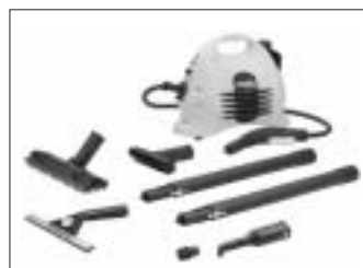
2002 verkaufte Kärcher 3,5 Millionen Geräte für den Endverbraucher. Der Gesamtumsatz im selben Jahr lag bei knapp 2 Milliarden DM.

Auch im Ausland nutzte man zur systematischen und gleichmäßigen Markterschließung das bewährte System (eine Markt pro Einwohner) aus Deutschland. Und erstaunlicherweise funktionierte es weltweit. Vergleichsgröße war das Bruttosozialprodukt des Landes. Angenommen dieses war pro Kopf 1,5 mal so hoch (Schweiz) wie das deutsche, so wurde die Einwohnerzahl des Landes (6 Mio.) damit multipliziert. So kam man auf den zu erwartenden Umsatz in DM (9 Mio. DM). Oder es betrug nur ein Zehntel (Brasilien) des deutschen Vergleichswertes so führte die Multiplikation mit der Einwohnerzahl (180 Mio.) zu einem zu erzielenden Umsatz von 18 Mio. DM (Bemerkung: alle Zahlenwerte sind fiktiv).